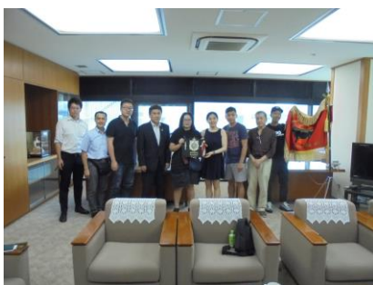
全農長崎県本部訪問