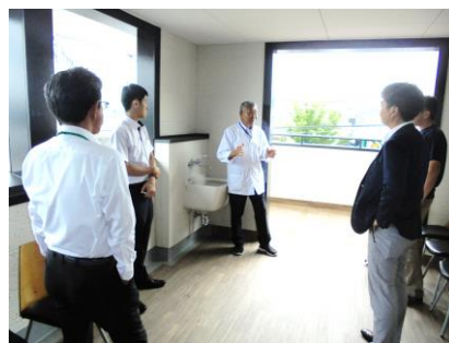
相川社長からの講話