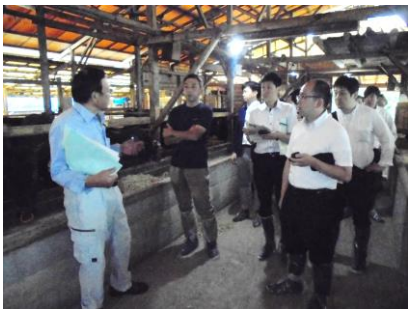
長崎和牛の生産状況見学

参加者全員が生産現場、食肉センターは初めて見学したとのこと、「とても勉強になった」、「今後のメニュー開発に活かしたい」等の感想が聞かれました。今後は観光客の皆様にも長崎和牛を楽しんでいただけるよう、ホテル・旅館と連携したPRにも取り組んでまいります。