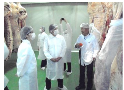
佐世保食肉センター見学