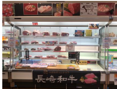
長崎和牛販売状況