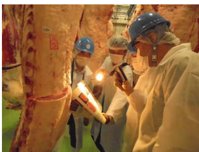
佐世保食肉センター見学