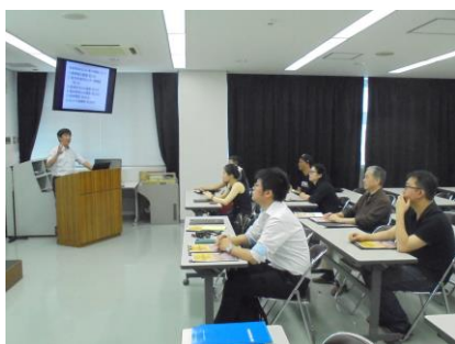
長崎和牛の説明状況