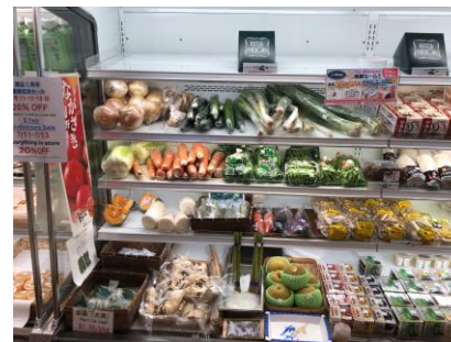
青果物の販売状況