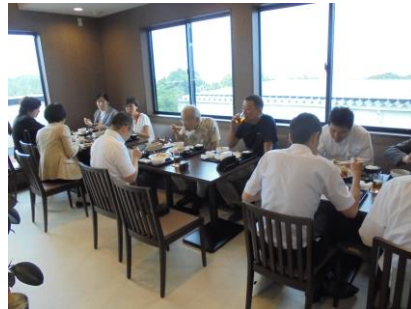
試食会の様子（肉のあいかわ）