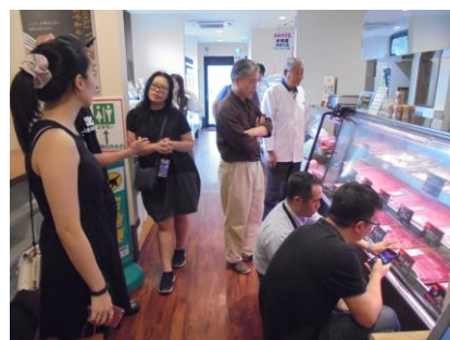
肉のあいかわ見学