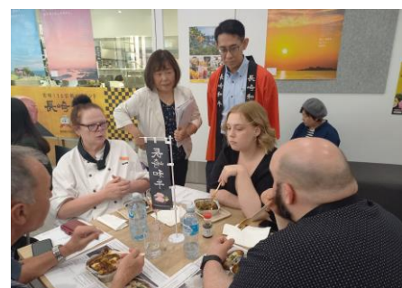
フプロモーションの様子