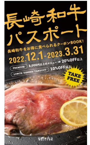
長崎和牛パスポート表紙

フリーペーパーとし、県内各所（空港、ホテル、大型量販店等）で県内外の方に2万部配布しました。掲載店舗からは反響が大きく、利用客が増えたとの声が聞かれました。