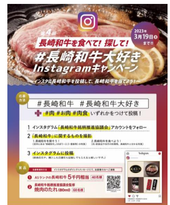
キャンペーンチラシ