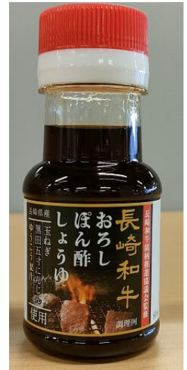
「長崎和牛おろしぼん酢しょうゆ」 (80ml)

これまでノベルティグッズとしてイベントやキャンペーンでプレゼントしていた、長崎和牛銘柄推進協議会監修の焼肉のたれ「長崎和牛おろしぼん酢しょうゆ」の販売が開始されました。長崎和牛をより美味しくいただくために開発された特製おろしぼん酢で、チョコレート醤油自慢の本醸造丸大豆醤油や、長崎県産の食材をふんだんに使った、長崎愛が詰まったたれです。是非、ご賞味ください。