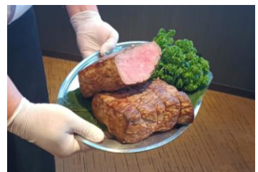
提供された長崎和牛