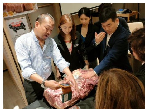
プロモーションの様子